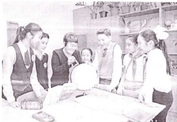
Мемлекет басшысы Қасым-Жомарт Тоқаевтың

Ұлттық қоғамдық сенім кеңесінде берген тапсырмасына сәйкес БҒМ «Оқуға құштар мектеп» жобасын бекіткен болатын. «Оқуға құштар мектеп» жобасыны аясында көркем әдебиеттер тізімі 4 бағыт бойынша жүзеге аспақ. Яғни олардың қатарына еліміздің үздік классиктернің кітаптары, ана тіліне аударылған шетелдік әлем әдебиетінің жауһарлар, сонымен бірге қазіргі заманғы ақын-жазушылардың кітаптары енетін болады. Білім берудегі кітап оқуға үйрету мәселелері әрдайым маңызды болғанымен, оқу сауаттылығын дамыту тапсырмасы ҚР-ның мемлекеттік білім беру стандартын жүзеге асыратын заманауи мектеп үшін жаңа сала болып табылады. Оқу сауаттылығы қазіргі қоғамдағы өмірге дайындық үшін ең маңызды көрсеткіштерінің бірі ретінде қарастырылады. Оқу мәдениеті оқушылардың нақты және жаратылыстану ғылымдарын, еңбекке үйрету және дене шынықтыру, сондай-ақ басқа да пәндерді табысты оқып білу үшін міндетті ме? Жауабы анық. Әрине, иә. «Оқу мәдениеті - өзін-өзі жетілдіру және өзін-өзі тәрбиелеу дағдыларын қалыптастыру факторы» деген түйін сөз бекер айтылмайды. Оқуды дамытуда әдістемелік әдістерді жүйелі және мақсатты түрде қолданған жағдайда оқушының дербес оқуын қалыптастыруға үлес қосады.